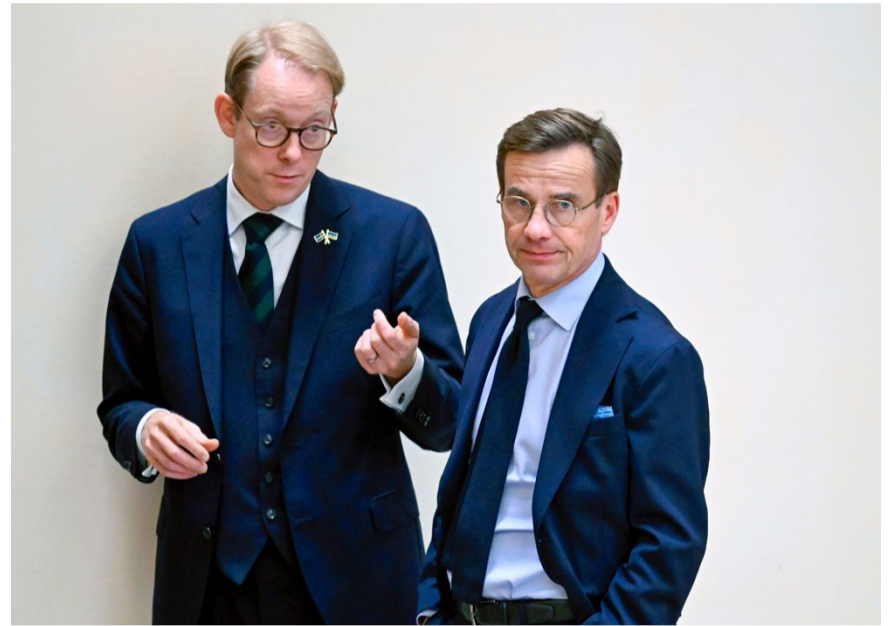
Utrikesminister Tobias Billström och statsminister Ulf Kristeresson.

På frågan hur klokt det skulle vara av en svensk tidning att publicera liknande bilder svarade Reinfeldt ”det ska väl varken jag eller Göran Persson ha synpunkter på” och att Sve-