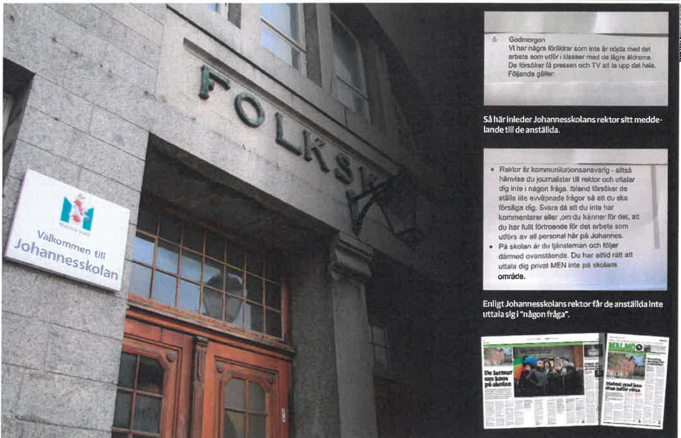
Internt dokument avslöjar: skolanställda berövas sin grundlagsskyddade yttrandefrihet.