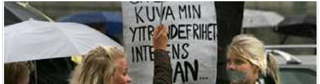
En handfull liberaler från FPU:s Örebro distrikt med silvertejp för munnen demonstrerade för yttrande- och tryckfrihet utanför tidningen Nerikes Allehanda 2007.

Begränsningarna kan i vissa fall ifrågasättas men de har det sympatiska draget att de gäller var och en.