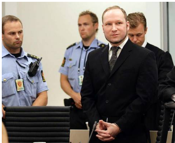
Anders Behring Breivik är ett av de brottsfall som behandlas i boken.